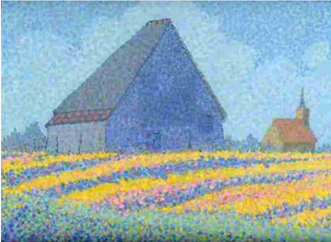
Boet in bollenveld, z.j.