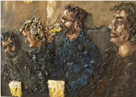
'n Vergrote lever en een gebroken hart, 1988 (Scene uit Marie's café)