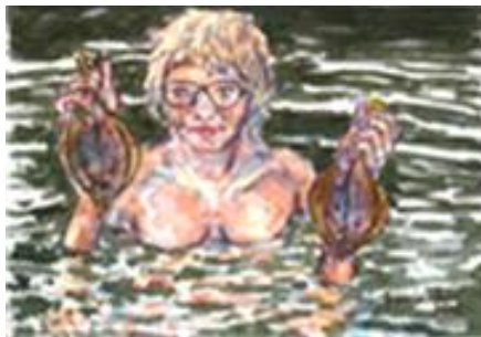
De vrouw van de vischboer, 2001

Eind jaren 80. Op een avond in de kroeg raakt Henk aan de praat met een voluptueuze Texelse schone. Ze drinken wat, het gesprek is geanimeerd en hij nodigt haar uit om mee te gaan naar zijn huis. Zij stemt in; een kleine romance ziet ze wel zitten. Thuis aangekomen pakt Henk zijn palet en begint er verf op te doen. Hij popelt om aan de slag te gaan, want hij wil haar prachtige ronde vormen al heel lang graag een keer schilderen: 'Kleed je maar uit en ga daar maar zitten'. Haar romantische voorstelling valt in duigen. 'Viezerik!', gilt ze. Woedend verlaat ze het pand, de schilder met z'n paletje verbouwereerd achterlatend.