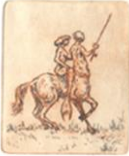
Centaur en zeemeermin (ingekleurde ets, 2003)