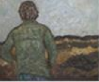
Op zoek naar wat Yin voor m'n Yang, 1989