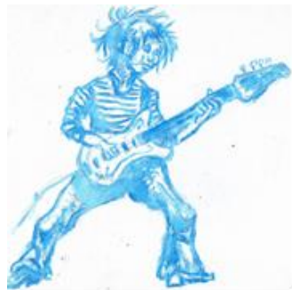
Mosquito Blues, 2014

Beperkt door z'n falende gezondheid trekt hij zich meer en meer terug uit het sociale leven. Eropuit gaan en contacten met vrienden worden gaandeweg minder belangrijk: Laat mij maar eindigen als kluisenaar in m'n eigen kerk. Hier voel ik me 't gelukkigst. Na het infarct probeert hij de draad weer op te pakken. Dat lukt slechts mondjesmaat en zeer moeizaam. Voor het maken van kleurrijke schilderijen blijkt de noodzakelijke energie en mobiliteit onvoldoende. Opnieuw neemt hij z'n toevlucht tot tekenen. Daarnaast maakt hij kleine monochrome paneeltjes. Aan zwarte humor ontbreekt het hem niet!