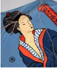
Chinese vlieger, 1987

Al vroeg blijken de twee kanten van Henks persoonlijkheid. In gezelschap is hij nadrukkelijk aanwezig, luidruchtig, vol verbale en fysieke bravoure. Daartegenover staat de dromer en denker, die zich uren- en soms dagenlang terugtrekt in zijn eigen binnenwereld met als enige gezelschap muziek, boeken, en teken- en schilderspullen.