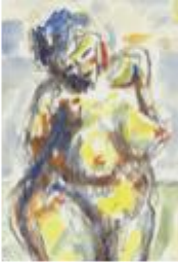
Ten smukke Danske kvinde, 1999 (De mooie Deense vindster)