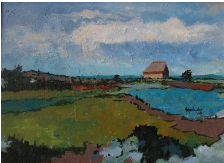
't Einde van de wereld, 2006