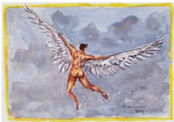
uit de serie: 'Tekeningen aan de keukentafel', 2000