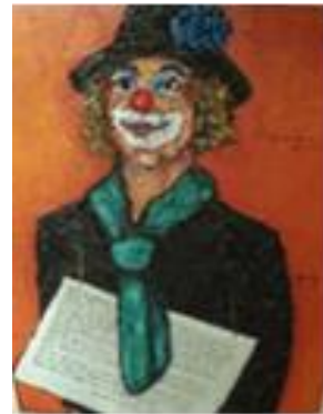
(serie Ouwe Sunderklaas)