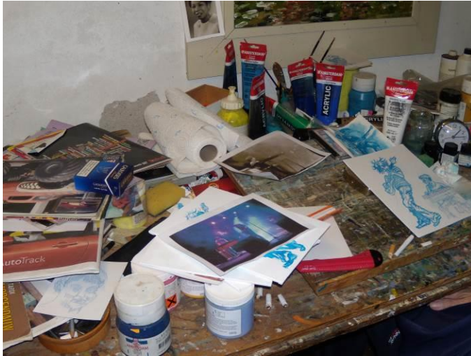
werktafel in De Vermaning, 23 dec. 2014