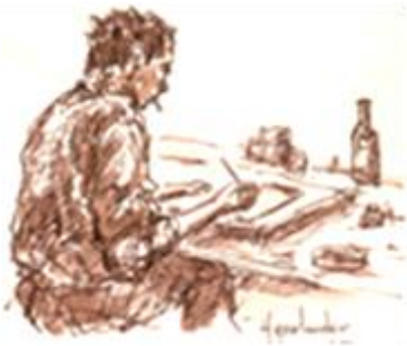
... En dan in de fles, 1995

Hij richt er zelfs een speciaal instituut voor op: Texels Instituut ter bevordering van flessenpost over zee. Het duurt niet lang of Henk gaat bewust flessenpost zitten tekenen en etsen, want de productie moet op peil blijven! Honderden flessen verdwijnen in zee. Op den duur maakt hij samen met de kleinkinderen ook flessenpostbootjes, een soort catamarans van meerdere plastic flesjes, bamboestokjes en zeildoek. Talloze flessenpostvinders laten merken dat ze aangenaam verrast zijn door hun vondst en sturen een bedankje, al dan niet vergezeld van een kaartje met de vindplek en een foto van het inmiddels ingelijste werk.