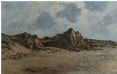
Afslag bij Paal 9, 1992

Schilderijen die hij heeft verkocht steelt hij bij gelegenheid soms terug, want achteraf schaamt hij zich dood voor het gebrek aan kwaliteit. Of het is gewoon een goed schilderij, waar de gelukkige bezitter bij nader inzien veel te weinig voor heeft betaald.