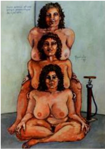
Trois Anna's et une pompe pneumatique du cyclyste, 1989 (3 Anna's en een fietspomp)