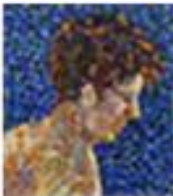
links: Nachtbaadster, 2011