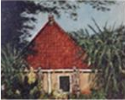
Op de vleugels van Ellis, 1991 (De Vermaning)

Als Henk schildert zit hij boven, op de kraak waar ooit het kerkorgel stond. Lekker in z'n eigen hol, omringd door een chaos aan verf, foto's, kunstboeken en z'n favoriete muziek: Niet aankomen, niks opruimen. Ik weet precies waar alles ligt. Ik streef naar een